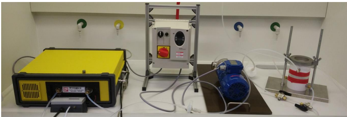
Abb. 1 Versuchsaapparaturen von links nach rechts: FTIR, davor: Differenzdruckmesser, Umrichter der Gaspumpe, Gaspumpe, 2-Kammer-Versuchsstand

Diese vier Bedingungen werden durch den folgenden Versuchsaufbau, dargestellt in Abb. 1, realisiert.