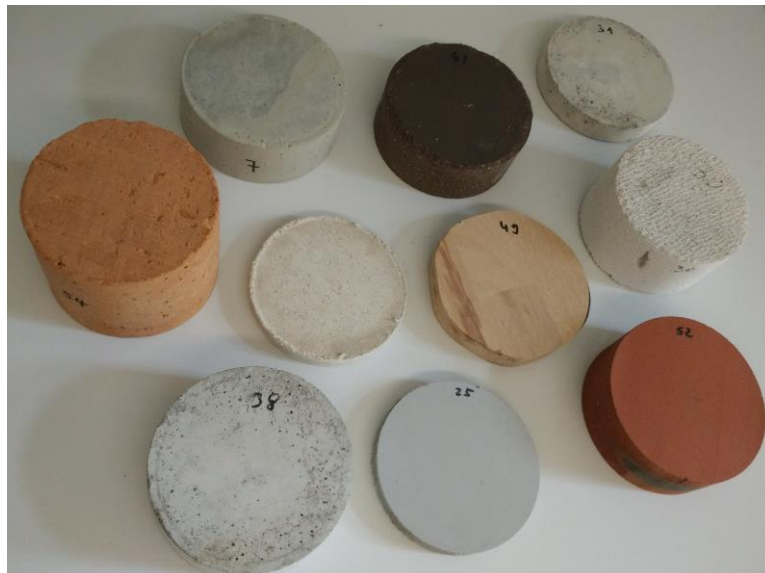
Abb. 5 Verschiedene Baustoffprüfkörper

Verschiedene Probekörper, siehe Abb. 5, wurden aus Gipskarton, Beton, selbstverdichtendem Beton, Ziegel, Holz, Ytong und Brandschutzplatten hergestellt. Die Mantelflächen werden für die Versuche mit Parafilm überzogen. Nach dem Einspannen werden die Übergänge zwischen Baustoffprobe und Halbkammern mit gasdichtem Klebeband abgedichtet.