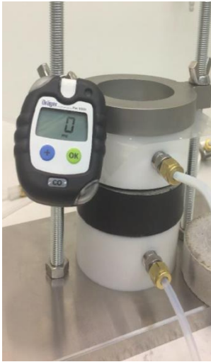
Abb. 3 Messzelle mit eingespanntem Baustoff

Die Halbkammern bestehen aus PTFE (Polytetrafluorethylen), auch unter dem Namen Teflon bekannt. PTFE zeichnet sich vor allem durch eine hohe chemische Beständigkeit gegenüber einer Vielzahl an Stoffen und seine geringen Adsorptionseigenschaften aus.